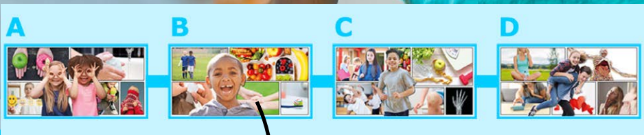
Elke ontwikkellijjn heeft een plaat met ik-doelen.

Tijdens de projecten werkt de leerling aan de ik-doelen van zijn kennis-, competentie-, taal- en rekenlijnen. Door de ontwikkellijnen krijgt de leerling (en zijn ouders) zicht op hoe hij zich ontwikkelt. Bij elke ontwikkellijjn staan leereenheden, zodat de leerling samen met de leerkracht kan bepalen wat de leerling kan doen om zich verder te ontwikkelen.