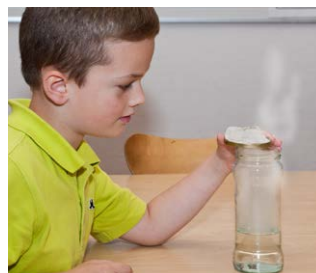
Maak een wolk in een pot

We hebben de temperatuur gemeten en een windwijzer en regenmeter gemaakt. Ik mocht ook het weer presenteren voor de camera. Het was net echt."