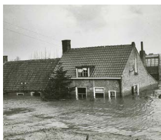
De watersnoodramp in 1953

“We hebben geleerd dat Nederland een echt waterland is. Wij wonen in laag Nederland. We hebben op een dijk gelopen met een mevrouw van het waterschap. Zij legde uit waarom dijken zo belangrijk zijn. We hebben er een persbericht over gemaakt. Ons verhaal kwam in de plaatselijke krant.”