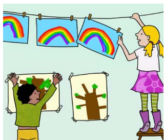
Maak een tentoonstelling

"Het was herfst. We hebben wind, zon en regen gevangen. Dat kan echt. We hebben ook een regenboog gemaakt met een glas water en ook een regenboog geschilderd. Op het einde hebben we een tentoonstelling gemaakt over de herfst. Alle papa's en mama's kwamen kijken."