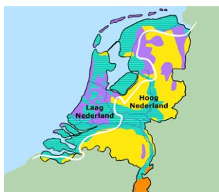
Hoog en laag Nederland