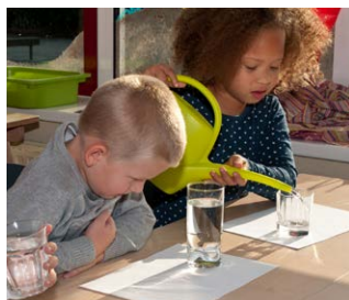
Houd een weerkalender bij