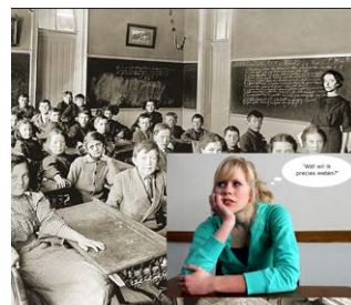
Doe historisch onderzoek