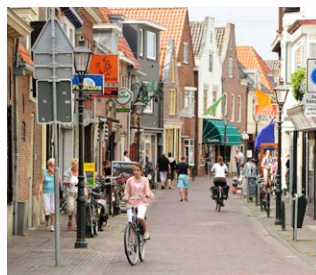
Verstedelijking van Nederland

"We hebben met de hele klas een wijk ontworpen. Elk groepje kreeg een stuk grond om in te richten. Toen we alle stukken grond aan elkaar legden, hadden we te veel zwembaden en te weinig huizen om in te wonen. Toen moesten we samen overleggen om er toch een goede wijk van de maken. Een mevrouw van de ruimtelijke ordening van de gemeente heeft ons plan beoordeeld."