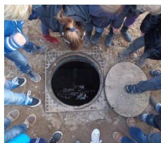
Buizen door de wijk

"Het project begon met een rondleiding door de wijk. Een man van de gemeente vertelde over het riool en de verlichting in de straat. We hebben ook papier geprikt in de straat. Ik wist niet dat voor de straat zorgen zoveel werk was."