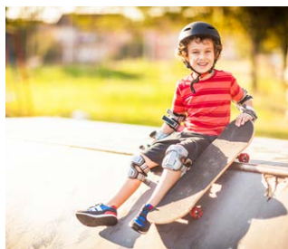
Waar is wat te doen in je wijk?

"We zijn eerst in het buurthuis geweest. We moesten daarna zelf een rondleiding maken door de wijk voor een nieuw klasgenootje. Ik gebruikte daarbij Google Earth. Dat was voor mijzelf ook heel leuk. Ik heb ontdekt dat er veel meer te doen is in onze buurt dan ik dacht."