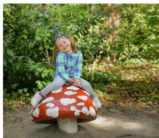
Toerisme in Nederland