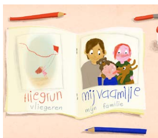
Maak een fotoboek