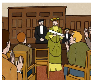
Leer over Aletta Jacobs

"Mijn opa is mijn held. Hij maakt me altijd blij en door hem kan ik goed kanoën. Vroeger had je ook helden. Aletta Jacobs is nog steeds een held. Door haar mag ik nu ook naar school. Michiel de Ruijter was een andere held. Dat varen vind ik wel stoer, maar ik vind hem geen echte held. We hebben van een meneer van het archief een rondleiding gehad langs beelden in ons dorp. Hij wist alles. Op het einde speelde ik een standbeeld van mijn eigen held."