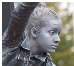
Speel een levend standbeeld