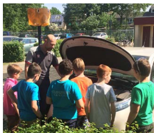
Een banenmarkt op school

"Elke week kwam er een vader of moeder vertellen over hun beroep. We mochten ook een keer mee naar een werkplaats. Ik wist niet dat er zoveel beroepen waren. Onze beroepswand was te klein voor al onze informatie. Ons groepje heeft ook een tableau vivant gemaakt over beroepen uit de middeleeuwen. Beroepen die nu heel anders zijn."