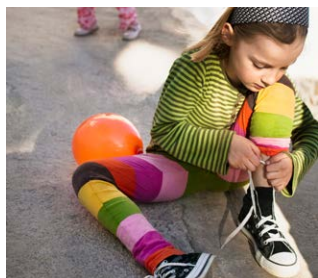
Leer een taak