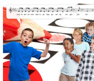
Lied: Stem op mij!