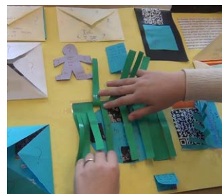
Maak een lapbook