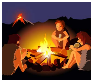
Van vuur tot lamp

"Ik heb een lapbook gemaakt over uitvindingen. Over de fiets en de gloeilamp. We mochten zelf vliegtuigjes vouwen en kijken wie het verste kwam. We hebben op het einde een nieuw muzikinstrument uitgevonden: de triool. Een muzikant kwam ons helpen. Het was best lastig om mooie klanken uit te vinden."