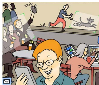
Sociale media gebruiken

"Eerst gingen we met bureau Halt door de wijk lopen. Toen maakte ik met 3 vrienden een rap over onze vriendschap, groepsdruk en je eigen mening. De tekst kwam in onze dorpskrant. De rap zingen we nog steeds."