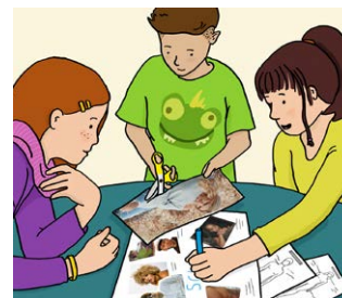
Een poster over nep en echt