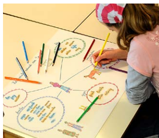
Teken je sociale netwerk