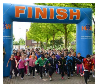
Organiseer een sponsoractie