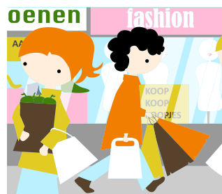
Consumeren en consuminderen

"Elk groepje kreeg 5 euro van de directeur te leen. Daar gingen we ons eigen bedrijf voor oprichten. We moesten geld gaan verdienen. Wij wilden armbandjes verkopen. Een ondernemer hielp ons met een begroting maken. We hebben kralen en touw ingekocht en slingers voor de versiering van onze kraam. De armbandjes hebben we voor 60 cent verkocht. Op het laatst hebben we de 5 euro teruggegeven aan de directeur en 220 euro ging naar het goede doel."