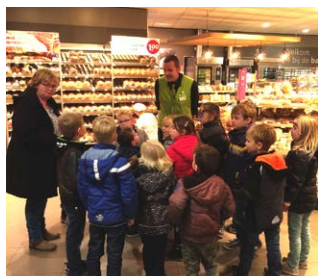
Een winkel bezoeken

"We hebben klusjes gedaan op school. Ook voor de directeur. We kregen overal muntjes voor. Die deden we in een eigen gemaakte spaarpot. Daardoor konden we dingen kopen in onze winkel met zelfgemaakte spulletjes. De winkel werd steeds groter. Een stukje van de winkel hebben we nog steeds."