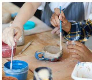
Maak een kado van klei