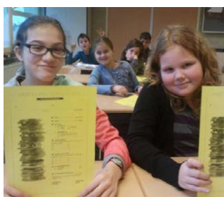
Maak je eigen zakgeldcontract

"We mochten met z'n tweeën zelf een dienst bedenken om te verkopen. Wij kozen voor onkruid wieden. Een echte verkoper kwam vertellen hoe je een dienst moet verkopen. Dat je goed moet vertellen wat je wel en niet doet, dat je heel beleefd moet zijn en ook van tevoren een prijs moet afspreken. We hebben samen wel 6,50 euro verdiend!"