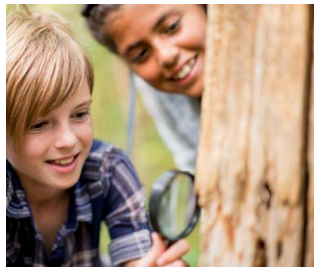
Gebruik een loep