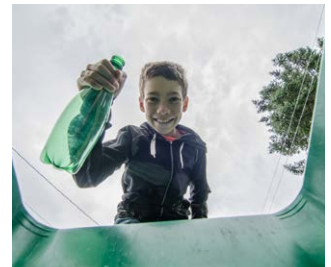
Hergebruiken en recyclen