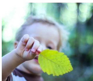
Zoek de boom

"We zijn veel buiten geweest. Op het schoolplein hebben we gezocht naar dieren. Daar zijn meer dieren dan ik dacht. In het park hebben we gezocht naar een eik, beuk, lijsterbes en spar. En in de klas hebben we schelpdieren en regenwormen met een loep onderzocht. Op het einde mocht ik een doos maken vol natuurschatten."