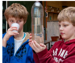
Zelf drinkwater maken

“We zijn naar het waterzuiveringsbedrijf geweest. Daarna heb ik met 4 anderen een do-it-yourself-tentoonstelling gemaakt. Daarin hebben we laten zien hoe je zelf drinkwater maakt, zelf stroom maakt uit fruit, zelf planten stekt en zelf recyclet. In tabellen hebben we ook laten zien hoe je zelf je energieverbruik en hoeveelheid afval berekent.”