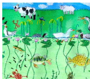
Schilder een sloot en berm

"Met een visnet, emmer en loep zijn we met z'n allen naar de sloot geweest. We hebben veel diertjes gevonden. De meneer van Veldwerk Nederland kende alle namen van de dieren en planten. We hebben ook planten gevonden die je kunt eten. Op school hebben we voor eetbare planten gezorgd. We hebben er een salade van gemaakt. Die smaakte best lekker."