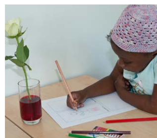
Hoe drinken planten?