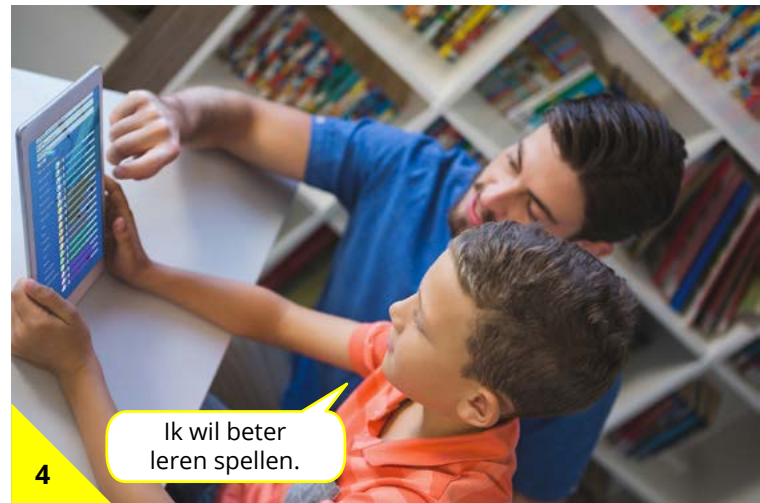
4 Bepaal samen met je leerkracht jouw doelen voor het volgende project.