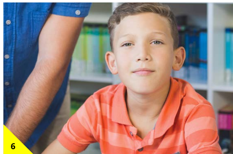
6 Zo word je steeds beter. En worden jouw balkjes steeds langer!