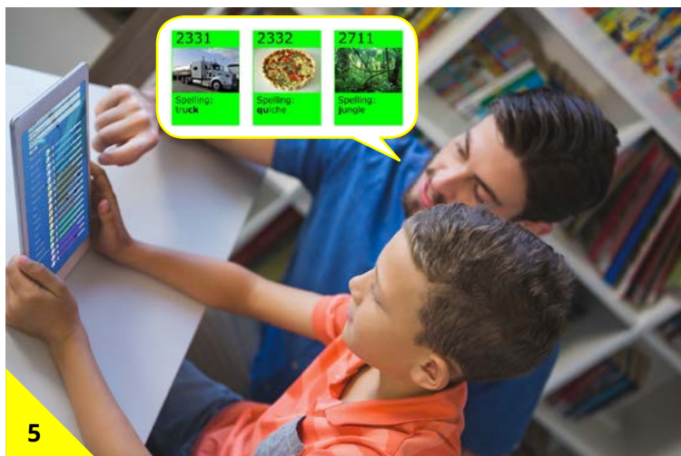
5 Samen zoeken jullie eenheden uit die bij jouw leerdoelen passen.