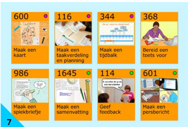
7 Als je er een oranje stepper bij gebruikt, leer je de steen nóg beter.