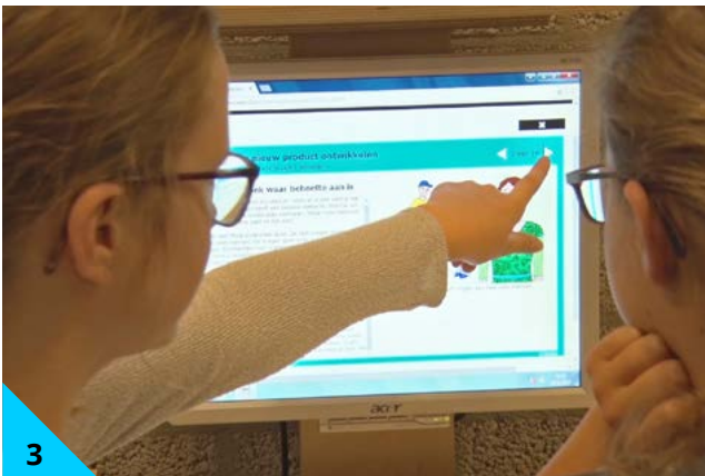
3 Daarna ga je leren. Alleen of met een maatje.