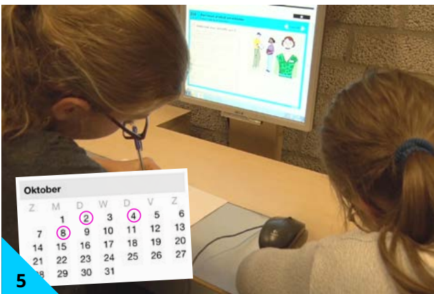
5 Je leert de steen ook door regelmatig te herhalen.