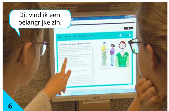
6 En je leert de steen door samen over de inhoud te praten.