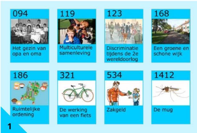
1 Door de blauwe stenen krijg je meer kennis van de wereld om je heen.