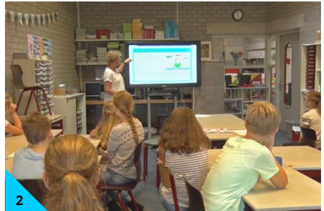
2 Beantwoord altijd eerst samen de vraag: Waarom is deze steen belangrijk voor het project?