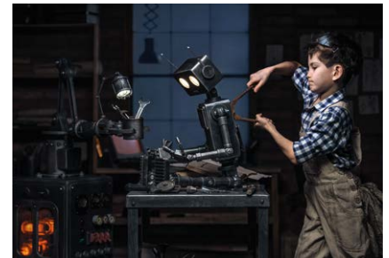
Leren voor later Learning for later