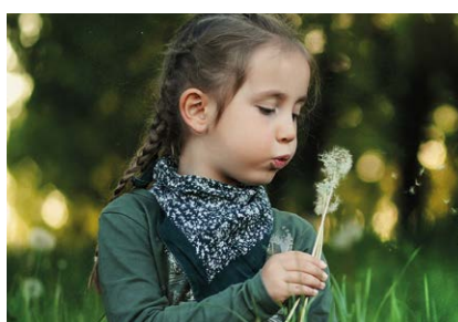
Omgaan met natuur Dealing with nature