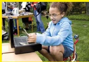
Een speelgoedmarkt houden