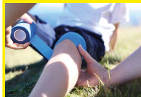
Veilig helpen 3