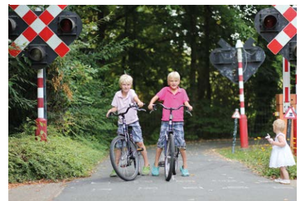
Veilig in het verkeer Keeping safe in traffic