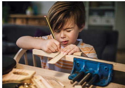
Maken van je eigen product Creating your own product