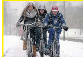
Veilig in het verkeer 4