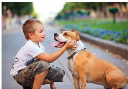
Zorgen voor dieren Caring for animals