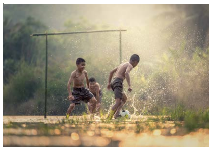
Beleven van onze planeet Experiencing our planet