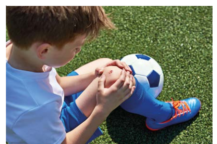
Veilig helpen Giving first aid safely