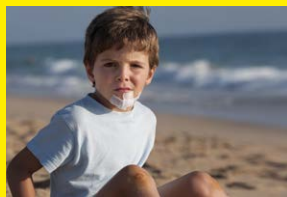
Veilig helpen 2