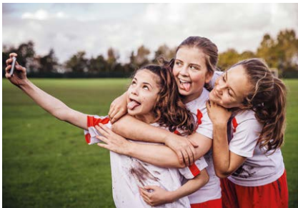
Omgaan met elkaar Interacting with others