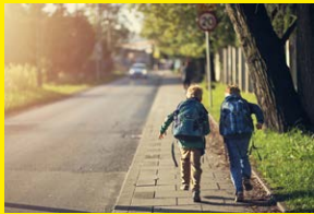
Veilig in het verkeer 1