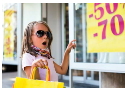
Omgaan met geld Handling money