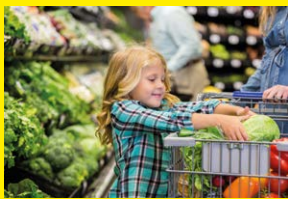
Een winkel maken