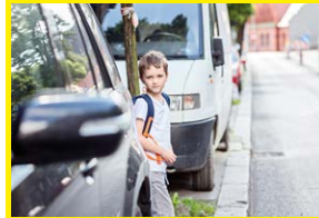
Veilig in het verkeer 3