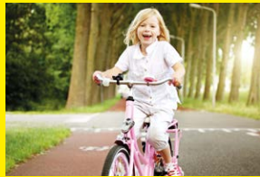
Veilig in het verkeer 2