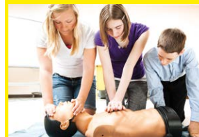
Veilig helpen 4