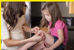
Veilig helpen 1