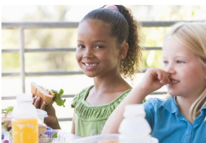
Zorgen voor jezelf en anderen Caring for yourself and others